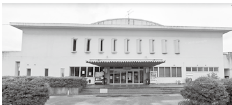
小竹町町民体育館

A【教育課長】補助事業等の要件により建て替えは対象にならないので、住民の避難所に使用できるように空調設備の整備をしっかりと行っていく。